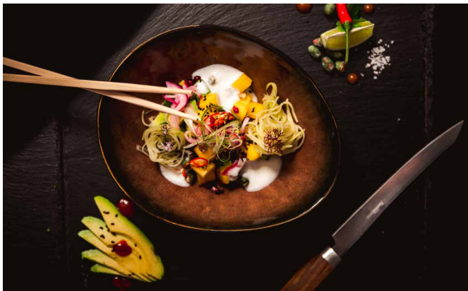
STRIZZI. MAXIMILIAN FUMY